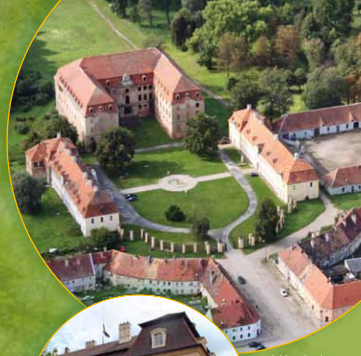
Schloss Brody Pałac Brody