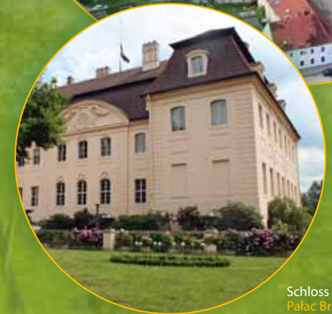
Schloss Branitz Pałac Branitz

Sehenswürdigkeiten (Auswahl): Wybrane atrakcje turystyczne: