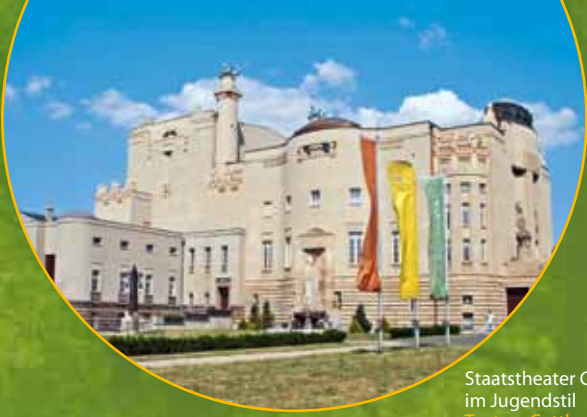
Staatstheater Cottbus im Jugendstil Teatr w Cottbus w stylu secesyjnym