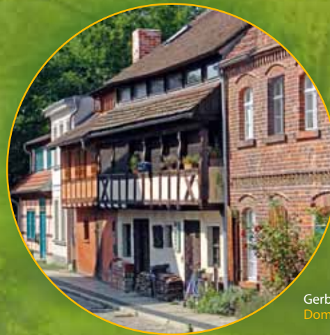
Gerberhäuser in Cottbus Domy garbarzy w Cottbus

CottbusService / Stadthalle Cottbus CottbusService w Hali Miejskiej w Cottbus Berliner Platz 6 03046 Cottbus Telefon: +49 355 7542-0 Telefax: +49 355 7542-455 E-Mail: cottbus-service@cmt-cottbus.de www.cottbus-tourismus.de