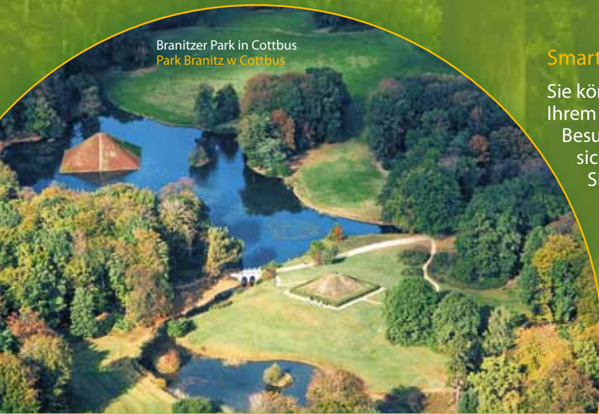
Branitzer Park in Cottbus Park Branitz w Cottbus

Cottbus jest drugim co do wielkości miastem Brandenburgii. Słynie ze swoich kunsztownie zaprojektowanych założeń parkowych. Można w nim odkryć księżycowe góry, piramidy, a nawet wilczy wąwóz. Do popularnych obiektów turystycznych zaliczane jest zabytkowe stare miasto, secesyjny teatr i Wieża Spremberska. Z Cottbus warto wybrać się na wycieczkę do Spreewaldu i na Pojezierze Łużyckie.