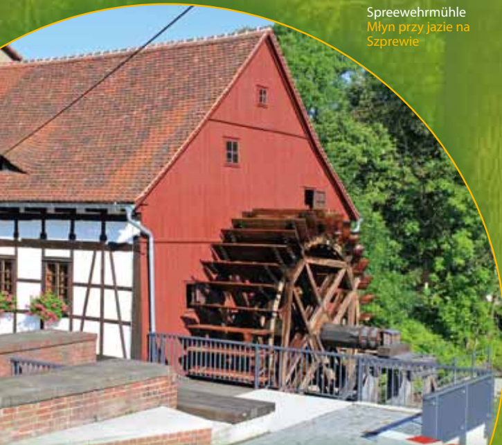
Sprewehmühle Młyn przy jazie na Szprewie