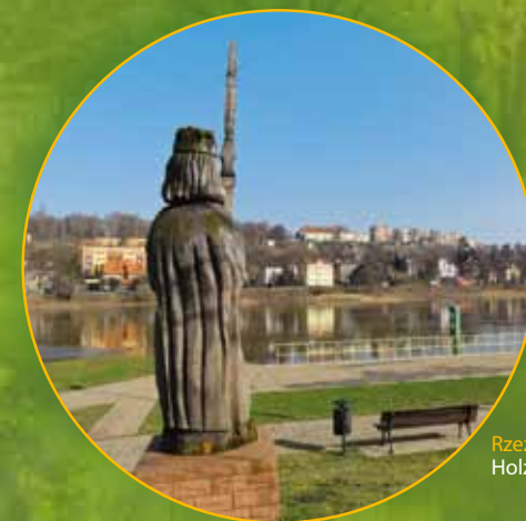
Rzeźba w drewnie przy porcie Holzskulptur am Hafen

Informacja Turystyczna w Raddusch w siedzibie Turystycznego Stowarzyszenia Szprewaldu Tourist-Information Raddusch in der Geschäftsstelle des Tourismusverbandes Spreewald Raddusch, Lindenstraße 1 03226 Vetschau/Spreewald Telefon: +49 35433 722-99 Telefax: +49 35433 722-28 E-Mail: reiseservice@spreewald.de www.spreewald.de