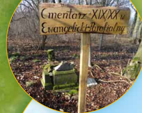
Cmentarz ewangelicki w Połupinie Evangelischer Friedhof Połupin