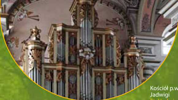
Kościół p.w. św. Jadwigi St. Hedwigskirche